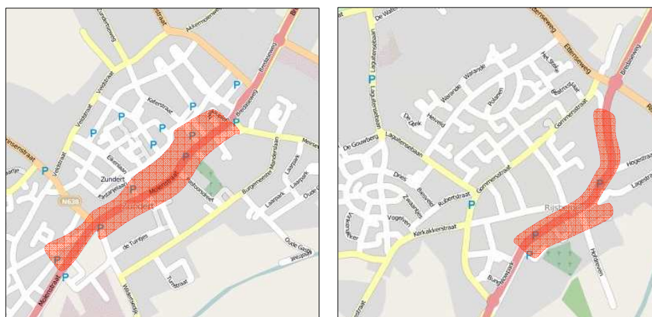
Figuur 2.1: Aanduiding centrumgebieden Zundert (links) en Rijsbergen (rechts)

De gemeente Zundert maakt gebruik van haar eigen parkeernormen die zijn gebaseerd op de algemene kencijfers van het CROW. De nieuwe gemeentelijke parkeernormen zijn in het volgende hoofdstuk opgenomen. Voor de gehele gemeente inclusief de kernen zijn de kencijfers van 'weinig stedelijk' gehanteerd. Daar waar de gemeentelijke parkeernormen niet in voorzien, wordt gehandeld in de geest van de CROW-systematiek